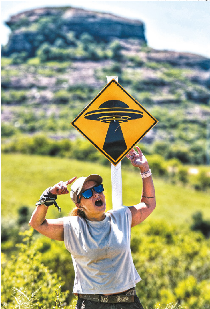
Placas de Ovnis sinalizam a visita de extraterrestres na área