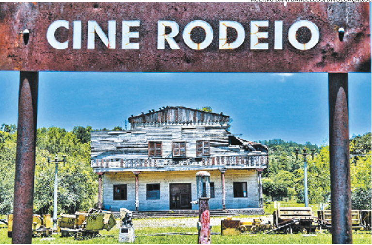
Antigo cinema abandonado desperta curiosidade dos visitantes