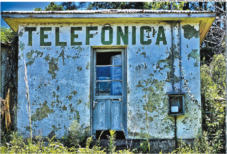
Resquícios de uma cidade abandonada na região de Caçapava do Sul

É da múltipla e talentosa jornalista e fotógrafa Daniela Barcellos que vem a sugestão de um passeio interessante para o verão, principalmente para quem gosta de trilhas, destinos insólitos e conhecimento. Partindo de Caçapava do Sul , a região é repleta de memórias de fatos históricos, lendas e curiosidades que remetem à visita de Ovnis, mas também é considerado Patrimônio Geológico da Unesco , como o Geoparque Caçapava e a estrada das guaritas. A beleza do lugar merece uma visita como a que Daniela fez por atrações formadas por paisagens naturais surpreendentes, famosa por formações rochosas de granito, imensos paredões de pedra esculpidos pela natureza, vales, grutas, cavernas e a Estrada das Guaritas, considerada uma das mais bonitas do mundo. Fazer trilhas, longas caminhadas pela Pedra do Segredo, da Caverna da Escuridão, Guaritas e as Minas do Camaquã e visitar uma insólita cidade com ares de abandonada. Avistamento de Ovnis também são indicações que tornam a região como referência mundial da ufologia. Como se não bastasse tudo isso, a região é conhecida pela qualidade de seus azeites de oliva, premiados no mundo todo. Vale conferir!