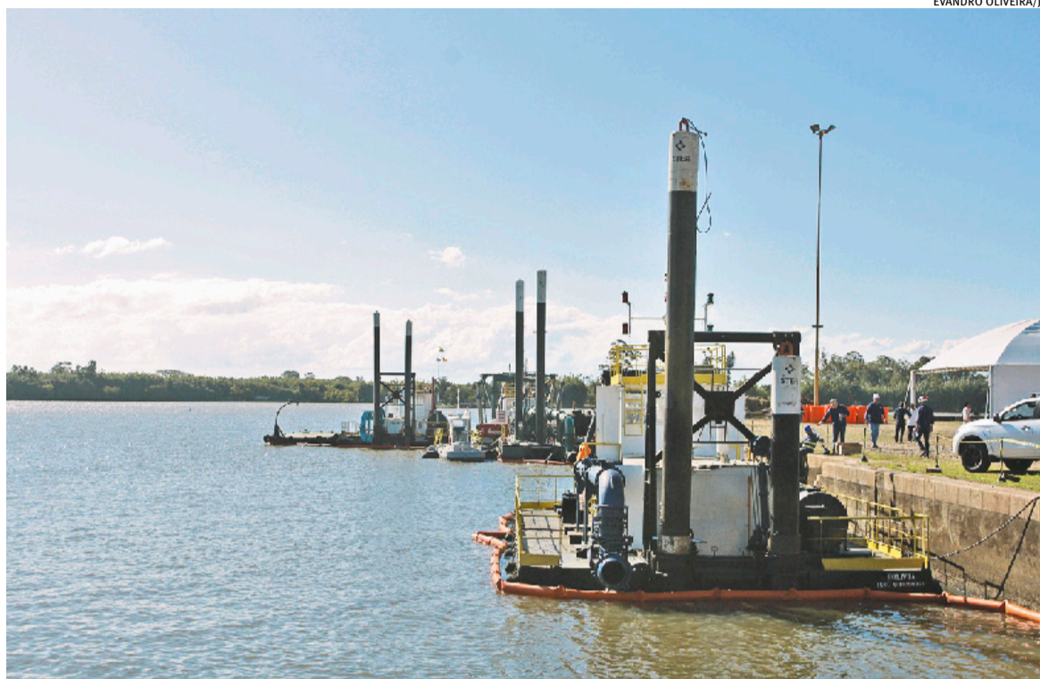
Marco inicial do projeto ocorreu com dragagem dos canais Furadinho, Pedras Brancas, Leitão e São Gonçalo