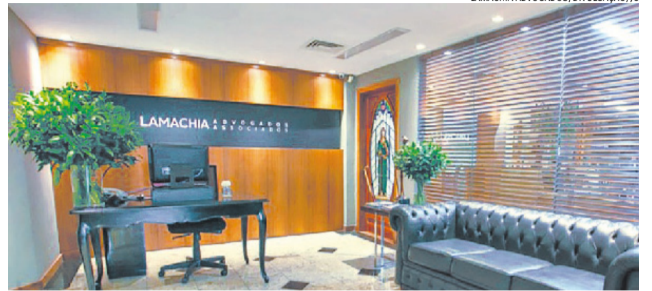
Escritório foi líder entre as marcas preferidas da pesquisa realizada pelo JC