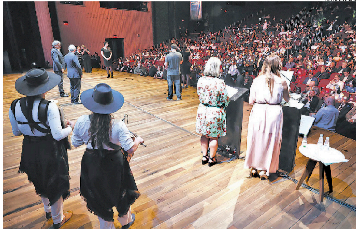
Evento, no Teatro Fieigs, em Porto Alegre, contou com apresentação tradicionalista e exibição de bandeira no telão

Para a Gerdau, que lidera tanto a lembrança quanto a preferência, o reconhecimento consolida o trabalho da empresa durante a