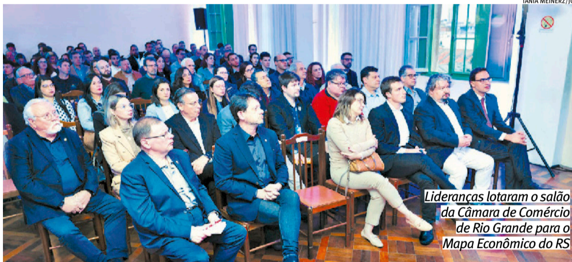
Lideranças lotaram o salão da Câmara de Comércio de Rio Grande para o Mapa Econômico do RS