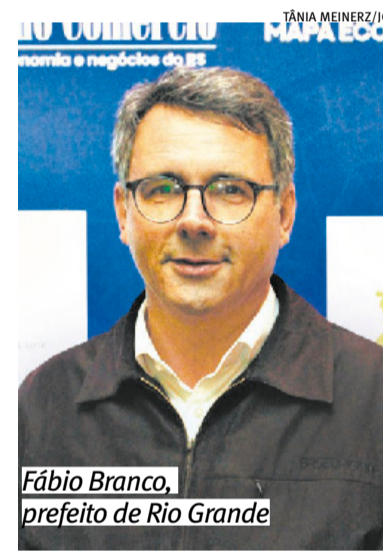
Fábio Branco, prefeito de Rio Grande