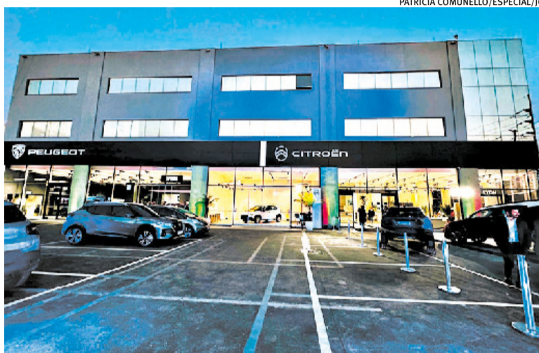
Loja, que vende duas marcas do portfólio, eleva a 10 filiais no Estado

Dez das 47 unidades do grupo estão no Estado, entre Porto Alegre (quatro), Canoas (duas), Novo Hamburgo (duas), Bento Gonçalves (uma) e Gravataí (uma). No