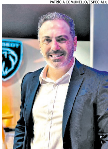
“Temos vontade de dobrar o número de lojas”, projeta Letti

O faturamento do Servopa deve bater em R$ 5 bilhões “ou até mais” este ano, projeta Letti, uma alta de 25% ante 2023. “Tem efeito da marca chinesa BYD (carros elétricos) que não representava quase nada em 2023. O mercado vai crescer 15%. A BYD representa muito, mas temos outras marcas puxando e novas lojas, como a de Porto Alegre e produtos novos”, assinala. O grupo, com sede em Curitiba e