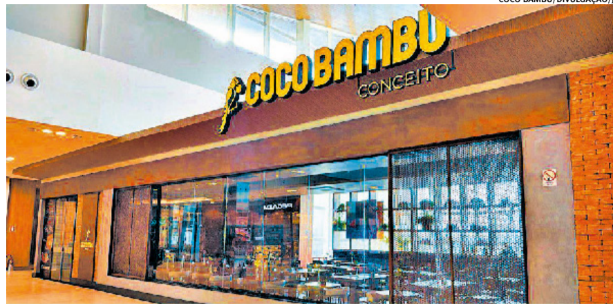
O empreendimento figura entre os mais lembrados e preferidos no Marcas 2024