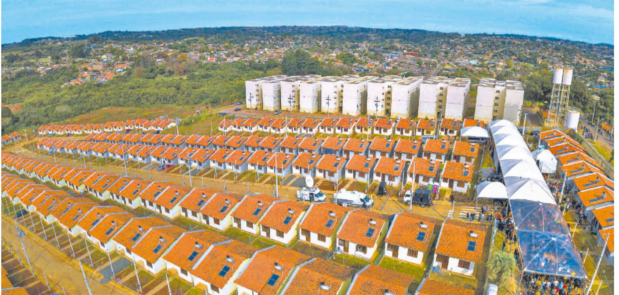
A inovação facilita a escalabilidade em projetos que precisam ser realizados de forma mais rápida, como no Minha Casa, Minha Vida, que foi retomado pelo governo federal neste ano