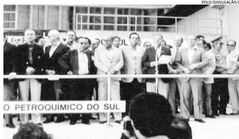
O relacionamento entre o governador Guazzelli e o presidente Geisel ajudou na decisão

Segundo o jornalista, o ativista não achava adequado instalar a estrutura tão próxima ao Guaíba. Ainda havia o receio que o polo pudesse seguir os passos da Borregaard, indústria de celulose também localizada na Região Metropolitana (hoje pertencente à CMPC), que na época verificava vários problemas relacionados à poluição. Contudo, Bones salienta que muitas das contrapartidas envolvendo os cuidados ambientais com a implantação da estrutura petroquímica foram devidas ao posicionamento de