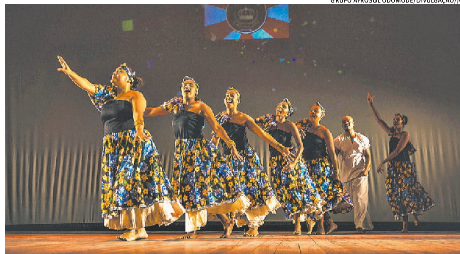
GRUPO AFROSUL ODOMODE

O evento acontece na CCMQ (Rua dos Andradas, 736), com entrada franca, e terá apresentação de dois espetáculos que versam sobre o carnaval da cidade de Porto Alegre. Às 20h, tem início Reminiscências - Memórias do nosso Carnaval . Apresentado pelo Grupo Afro-Sul Odomode (foto), a performance busca enaltecer a festa popular, em uma performance que une declaração de amor e agradecimento. Por fim, às 21h, a Escola de Samba Imperatriz Dona Leopoldina vai cantar seus sambas, que tradicionalmente carregam a exaltação a homens e mulheres que contribuem na formação da cultura afro-gaúcha.