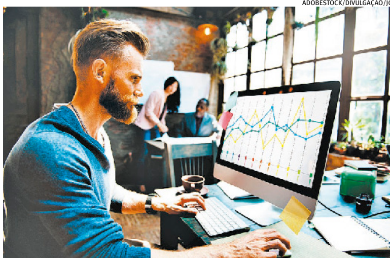
Compra de participação em startups por VC foi a maior de 2022

Os investimentos dos fundos de private equity, ou seja, a compra de participações em empresa