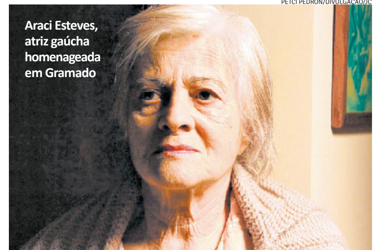
Araci Esteves, atriz gaúcha homenageada em Gramado