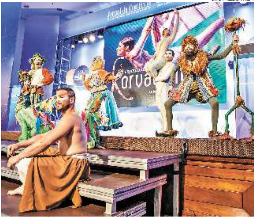
Artistas do Korvatunturi, de Gramadó, fizeram bela apresentação

Um dos poucos fatos rotineiros no evento Marcas de Quem Decide, ontem, foi o salão lotado de empresários, dirigentes de entidades, gestores, publicitários e jornalistas, como sempre acontece. Houve novidades durante as rodas de bate-papo no café antes da entrega dos certificados: apresentação de uma violinista e do grupo Korvatunturi.