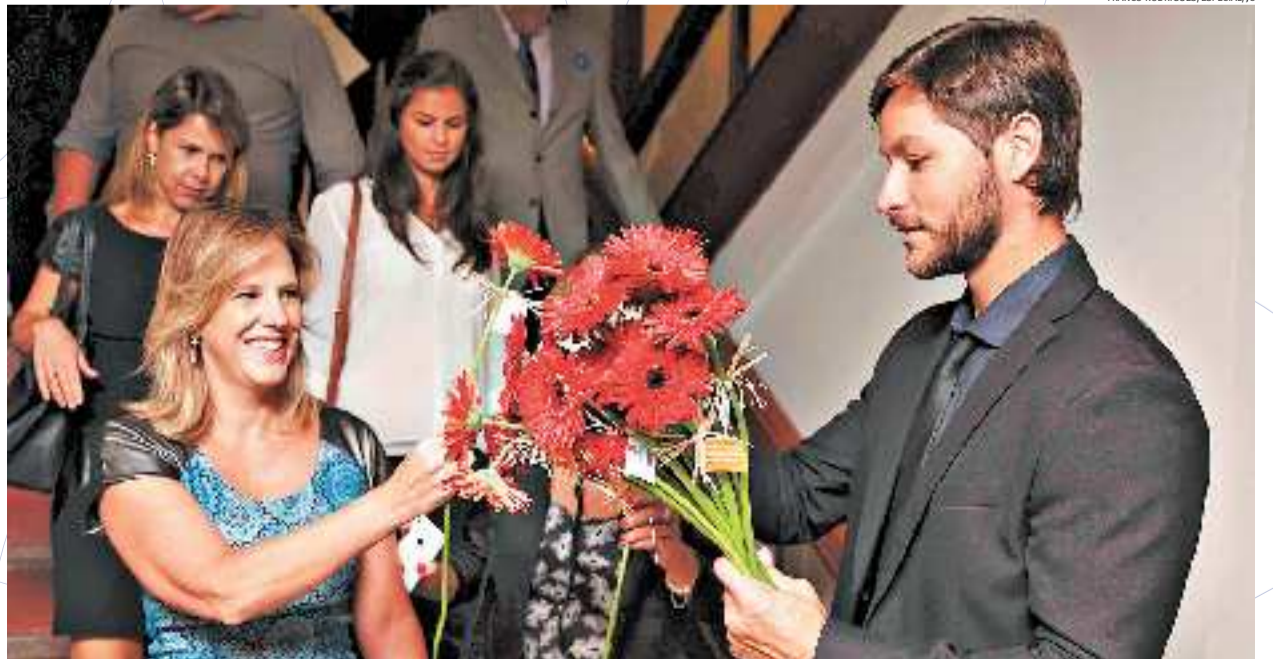
Ao final da premiação, todas as mulheres que participaram receberam flores pela data internacional