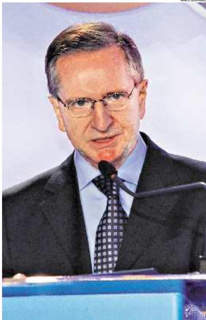
Tumelero diz que é preciso atitude em momentos difíceis

Tumelero lembrou, ainda, que o JC está integrado em todas as plataformas e mídias sociais. Assim, o assinante tem acesso ao jornal digital para ler quando e onde quiser através do smartphone, tablet, iPad e iPhone.