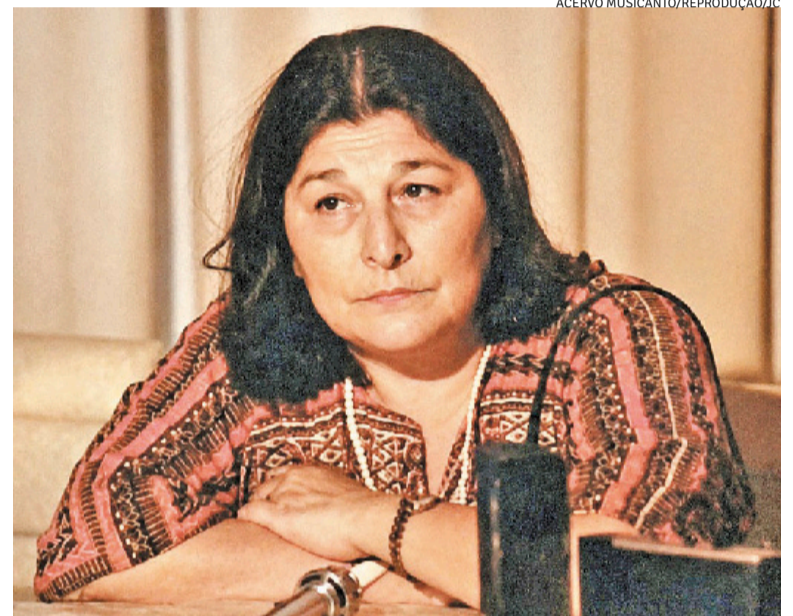
Mercedes Sosa concede entrevista coletiva em Santa Rosa, logo antes do show