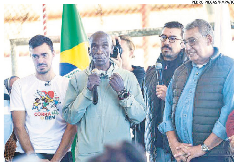
Kipchoge participará do percurso na capital gaúcha

A prova principal será realizada no domingo. A largada da maratona ocorrerá junto ao Monumento ao Expedicionário, no Parque Farroupilha (Redenção), enquanto a chegada será no Parque Harmonia. O percurso passa por alguns dos principais cartões-postais da cidade, como Mercado Público, Cais Mauá, Usina do Gasômetro, Orla do Guaíba e outras vias tradicionais da Capital.