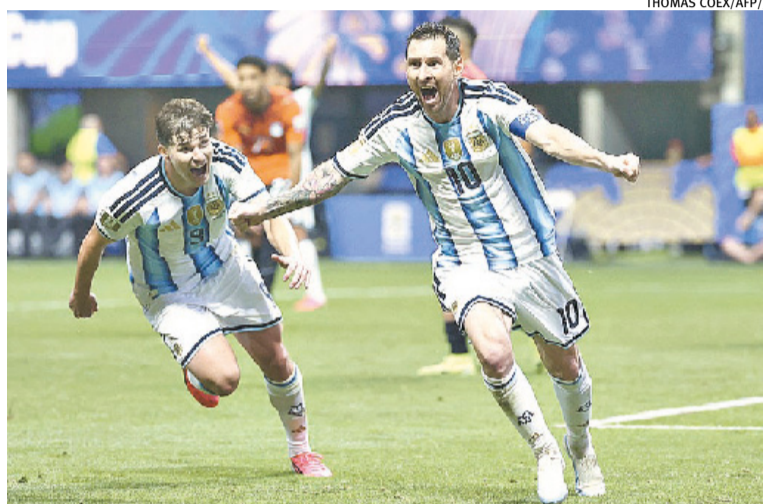
Com gol e assistência de Messi, seleção argentina avançou para as quartas

Aos 15 minutos, o Egito saiu na frente. Salah cobrou escanteio curto, Ashour chamou os marcadores para dançar e tocou para