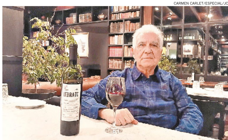
Melnitzky destaca presença dos turistas brasileiros na Comarca Las Liebres