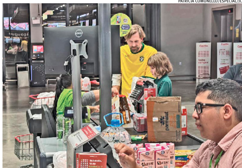
Registros mostram itens mais buscados para assistir às partidas

O que está vendendo mais na Copa de 2026? A coluna traz a apuração no mais recente Painel Nacional do Varejo Alimentar, da Scanntech, gigante de dados do setor, captados diretamente das transações. Na fase de grupos, categorias mais relacionadas ao consumo durante as partidas registraram aumento de 12,1% no volume de vendas no dia do jogo e de 4,4% na véspera. O perfil de compras mostra que o torcedor montou em casa a estrutura para assistir aos jogos. Petiscos lideram com venda mais alta de amendoim (167,1%), milho para pi-