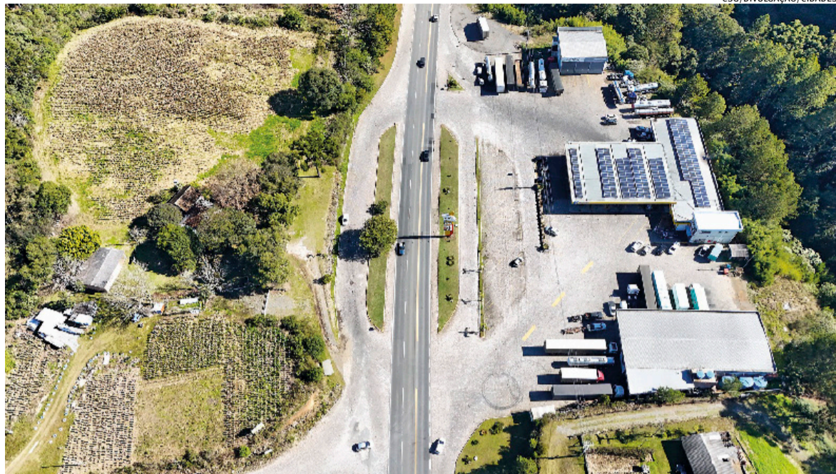
Concessionária prevê investimento de R$ 380 milhões para o trecho de 18 quilômetros entre os dois municípios da Serra

A CSG inicia nesta segunda-feira (6) uma das maiores obras de infraestrutura viária previstas no contrato de concessão. Após o início da duplicação do Contorno Norte de Caxias do Sul, a concessionária avança com investimento estimado de R$ 380 milhões para a duplicação da RSC-453, entre Garibaldi e Farroupilha. A previsão de finalização é para março de 2028.