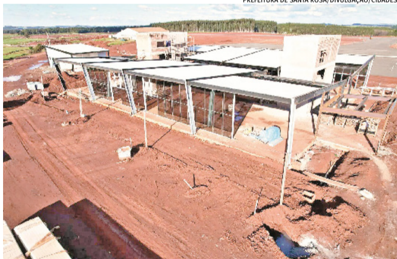
Projeto prevê uma estrutura capaz de receber aviões com até 185 passageiros