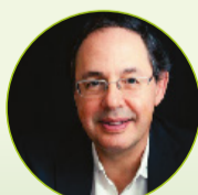
EDUARDO GIANNETTI Economista