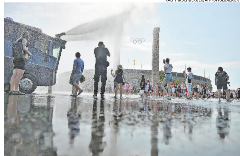
Polícia utiliza canhões de água em área pública de Berlim, na Alemanha