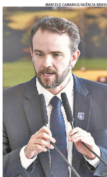
Governo já executou R$ 1,003 bi da subvenção ao diesel, disse Durigan

R$ 11,00 por botijão de gás de 13 quilos. Esta foi a saída encontrada pela equipe econômica de ten-