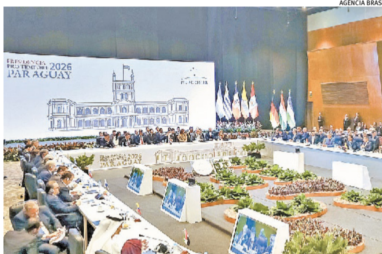
Encontro reuniu chefes de Brasil, Chile, Paraguai, Uruguai, Equador e Bolívia

Entre os debates da atual cúpula do Mercosul, está a criação do novo Fundo para a Convergência Estrutural do Mercosul (Focem), em substituição ao atual, considerado insuficiente. O Brasil anunciou que vai destinar US$ 100 milhões, por ano, ao novo Focem. O mecanismo foi criado em 2004 para reduzir as desigualdades entre os países do bloco sul-americano. “Estamos prontos para passar