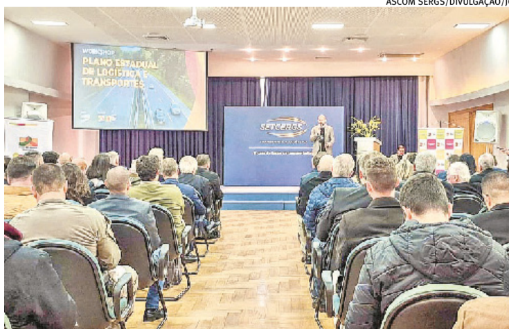
Encontro reuniu representantes do governo gaúcho e de empresas do setor

O diagnóstico da infraestrutura de transportes e os cenários futuros do Plano Estadual de Logística e Transportes 2050 foram apresentados ontem na Capital, em evento que reuniu lideranças dos setores público e privado. p. 8