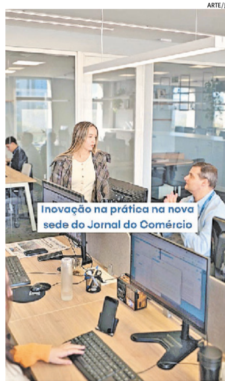
Inovação na prática na nova sede do Jornal do Comércio