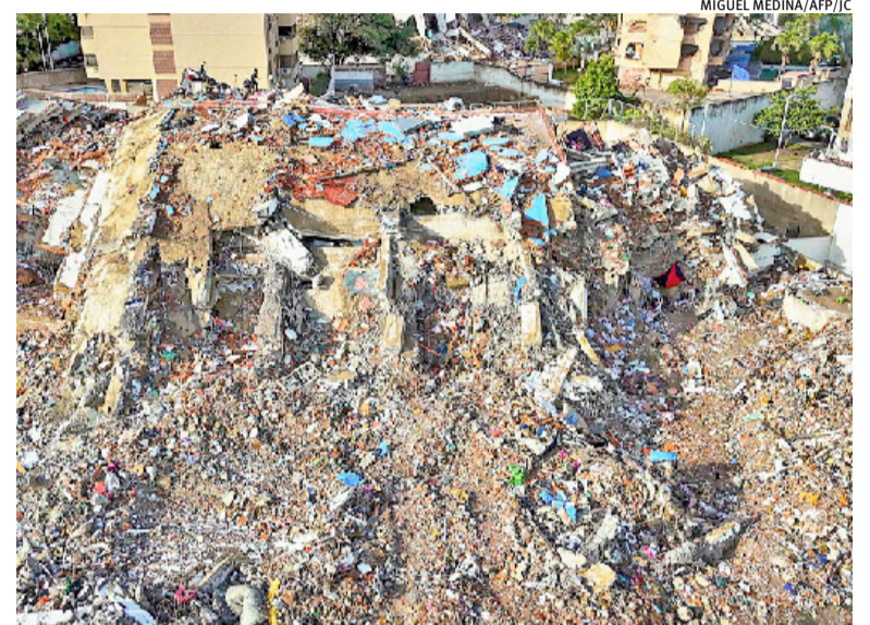
País sul-americano foi devastado por terremotos de grande magnitude

Vale ressaltar que itens de vestuário, roupas de cama, tênis, toalhas e óleo de cozinha não são aceitos. Quanto aos alimentos,