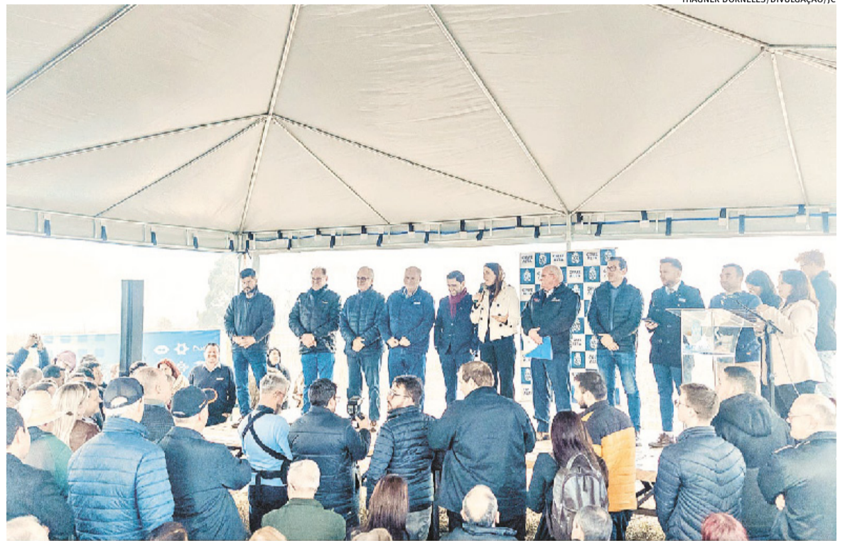
Solenidade marcou o lançamento das obras do complexo, que tem previsão de operar em maio de 2028