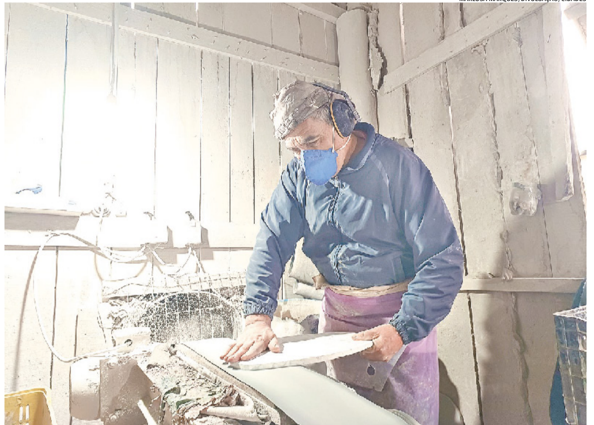
Ainda que tenha uma representatividade no setor de pedras, processo de industrialização para produção de itens ainda é lenta

Apesar disso, o município caminha a passos lentos em termos de industrialização do setor. "Temos poucas empresas