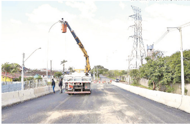
Quando pronto, acesso vai facilitar chegada de visitantes ao Parque Assis Brasil