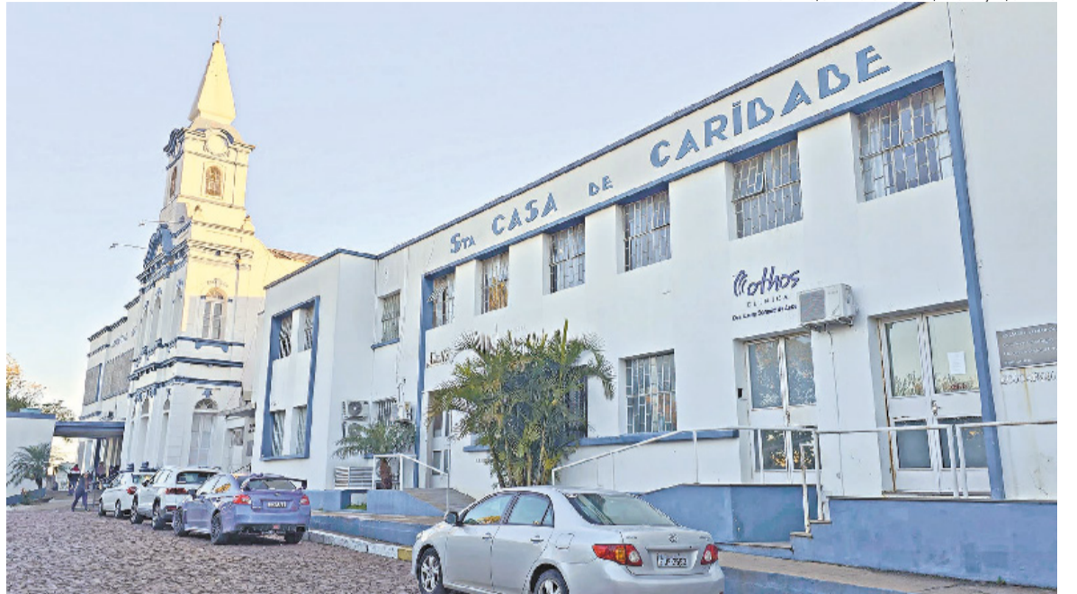
Com dívidas na casa dos R$ 100 milhões e greve de profissionais, casa de saúde passa a ter gestor provisório até o fim do ano