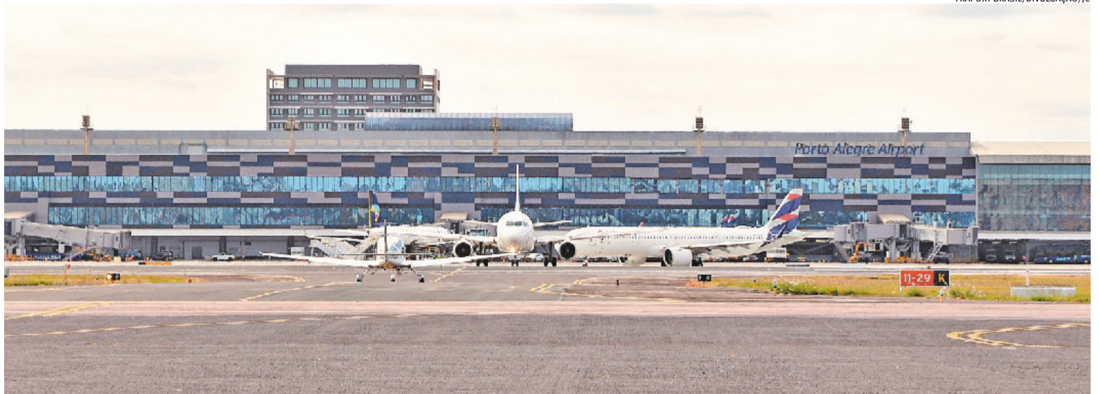
Desempenho registrado no início deste ano consolida recuperação conquistada em 2025, após ano de retração devido à paralisação em 2024

O desempenho de 2026 ocorre após a recuperação consolidada registrada em 2025, quando o Salgado Filho movimentou 7,5 milhões de passageiros, superando ligeiramente os 7,4 milhões contabilizados em 2023, último ano completo antes da interrupção