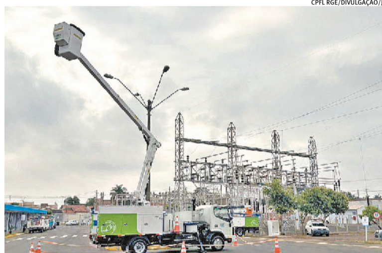
Empresa gaúcha estreia uso de eletricidade em veículos pesados

O dirigente complementa que a CPFL quer, futuramente, ter algumas estações operacionais totalmente equipadas com frotas eletrificadas. Contudo, ele assinala que o maior desafio para isso é justamente os veículos operacionais, por isso a importância dos testes. “Imagina estar com um eletricista, em cima de um cesto aéreo, e dar um problema no caminhão? Porque todo o mecanis-