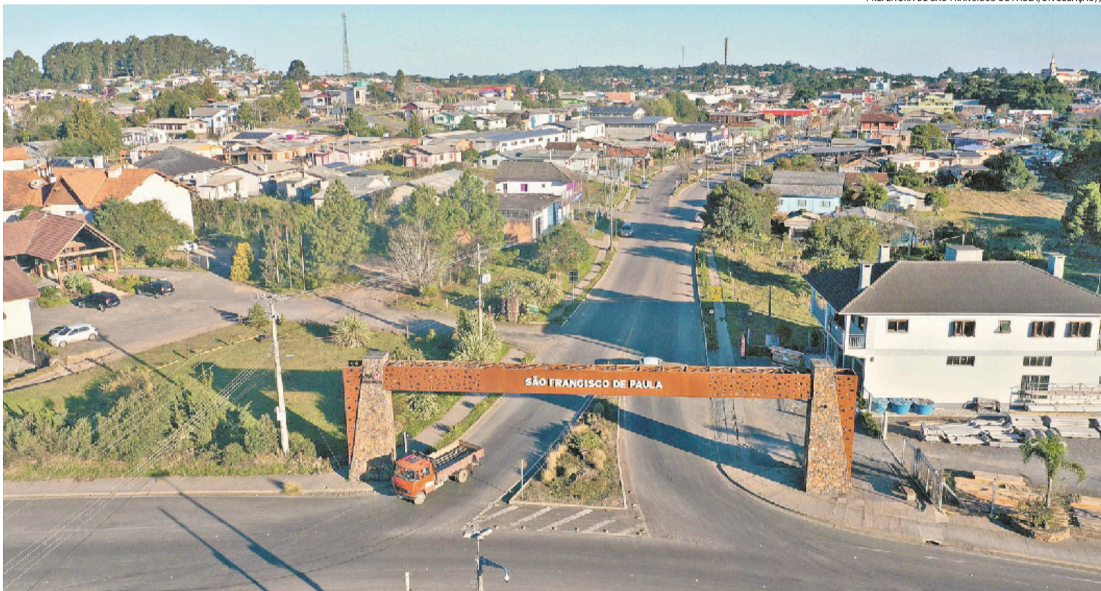
Com PIB estimado em R$ 1,2 bilhão, município une a força do agronegócio à expansão do turismo e lança o Plano São Chico 2025 Caderno Empresas

Aeroporto de Porto Alegre deve superar os 2 milhões de passageiros entre junho e agosto p. 10