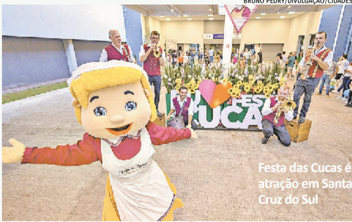
Festa das Cucas é atração em Santa Cruz do Sul

Com o início do mês de julho, apresentações musicais ganham destaque na programação cultural. Com a comemoração do dia do Rock, em 13 de julho, cidades do Rio Grande do Sul recebem shows e até exposições artísticas homenageando o gênero. Feiras tradicionais também chamam atenção, como em Santa Cruz do Sul, com a Festa das Cucas e em Marau, com a retomada do Festival Nacional do Salame. Confira abaixo a agenda de eventos para o interior do Rio Grande do Sul do dia 29 de junho a 5 de julho.