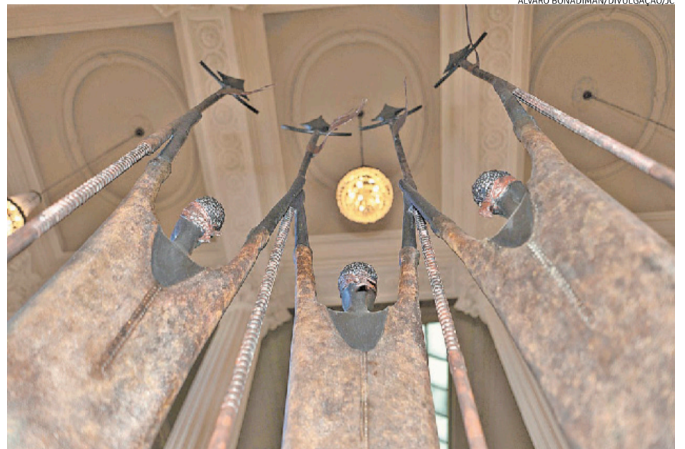
Visitação especial apresenta obras em homenagem às Quitadeiras e aos Lanceiros Negros

‘Cabaré da vida pequena’ é errático em seu roteiro, característica do gênero: vai da comédia ao drama