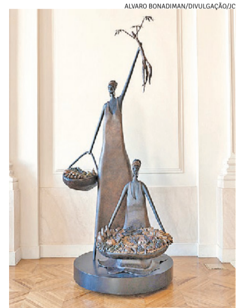
Peças de arte passam a integrar o acervo oficial da instituição pública

Com a inauguração, as obras entram definitivamente para o roteiro das visitas mediadas que acontecem rotineiramente durante a semana e que, excepcionalmente neste sábado e domingo, ganham uma edição especial estendida à Ala Residencial do palácio.