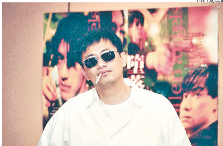
Diretor chinês é homenageado na Sala Redenção, nesta sexta-feira