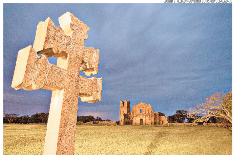
Entre pedras centenárias e memórias preservadas, as Missões convidam a uma viagem pela história e pela alma do Rio Grande do Sul