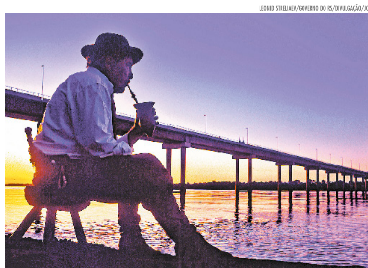
Entre fronteiras, o chimarrão aproxima culturas e revela a identidade de um território marcado por história, tradição e pertencimento