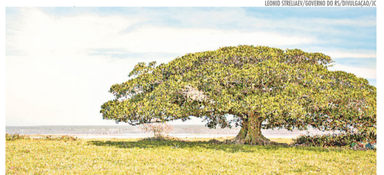
Costa Doce: entre lagoas, sabores e paisagens tranquilas, o inverno revela um convite à contemplação

Viva o inverno gaúcho. Conheça seu próximo destino em vivaos.com.br