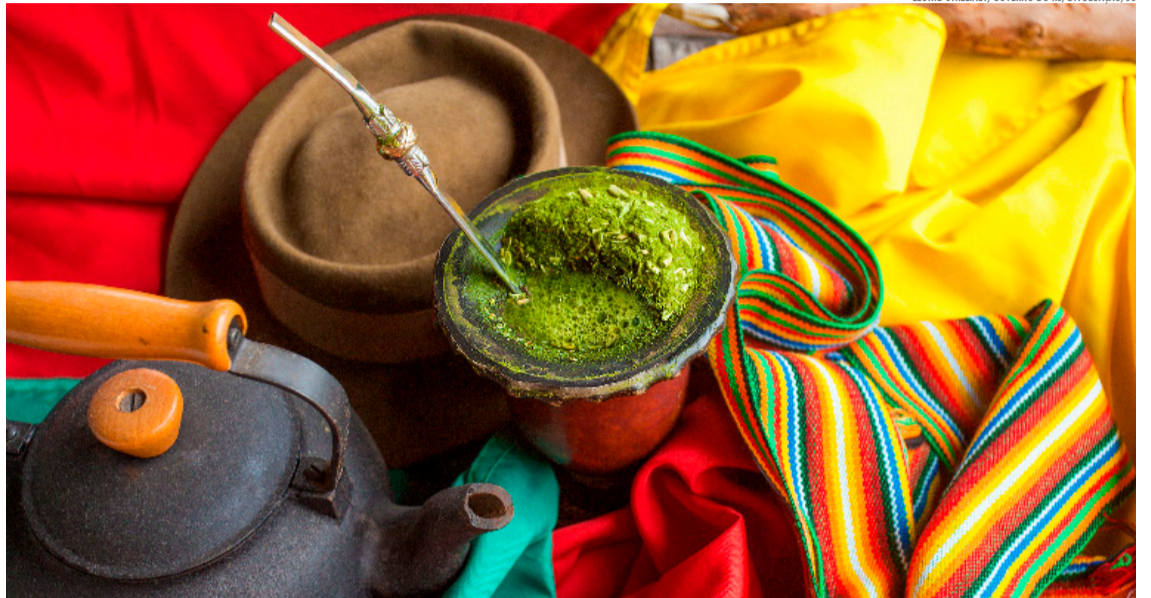
Porto Alegre, Vales, Missões, Costa Doce e Fronteira mostram que o frio também combina com cultura urbana, memória, fé, natureza e identidade regional

Esse mosaico regional ajuda a explicar o bom momento do turismo no Estado. Em 2025, o Rio Grande do Sul recebeu 1,4 milhão de turistas estrangeiros entre janeiro e novembro, crescimento de 86,4% em relação ao mesmo pe-