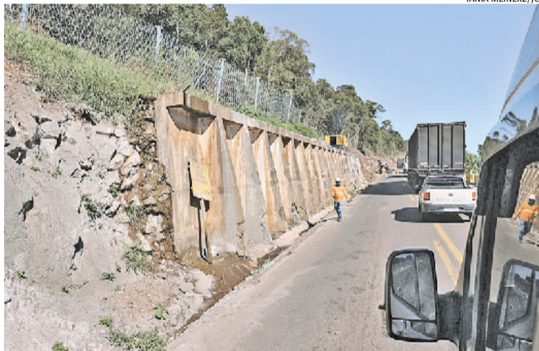
A partir de 2 de julho, sistema de comboio, que vinha sendo utilizado, será suspenso