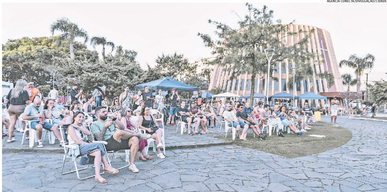
Bento Jazz & Wine Festival costuma ocorrer no mês de dezembro e oferece uma série de atrações gratuitas ao público, que se reúne na principal praça do município

A terceira edição, em 2022, tornou o festival referência no país, cujo reconhecimento se deu em Brasília, conquistando o Prêmio Profissionais da Música (PPM) na categoria Melhor Festival de Jazz e Instrumental do Brasil.