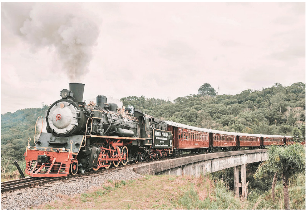
Passeio de Maria Fumaça, que engloba as cidades de Garibaldi e de Carlos Barbosa, é um dos prediletos pelos visitantes da cidade