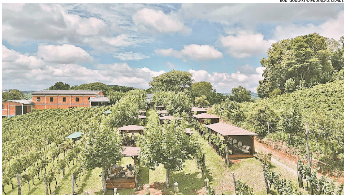
Área onde ficam os parreirais da Vinícola Larentis ganhou 18 bangalôs, que podem ser usados para receber piqueniques

Confirmando o que os operadores de turismo relataram à reportagem, além dos casais, os bangalôs abrigaram ainda encontros de grupos familiares. No local, que também sedia ensaios fotográficos, o Lounge Larentis tem no cardápio opções de entradinhas e petiscos para happy hour e pratos quentes para o almoço, além da cesta