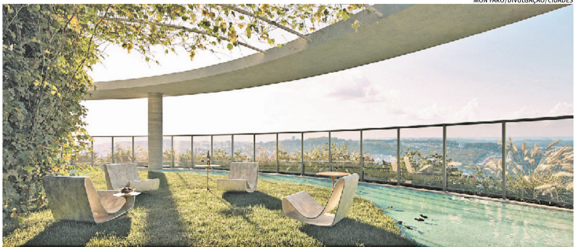
Jardins Dona Isabel tem previsão de entrega para 2030 e, desde o lançamento, em 2025, já teve R$ 200 milhões vendidos

Valorizando a cultura local, o nome do projeto (que já recebeu prêmios internacionais nos Estados Unidos, Portugal e Suíça por Arquitetura de Uso Misto) foi escolhido porque era importante ser feminino, ter conexão histórica - Bento Gonçalves era a Colônia Dona Isabel, durante o Império, em homenagem à primeira regente do Brasil, que assinou a Lei Aurea - e trazer o conceito das experiências de jardins.