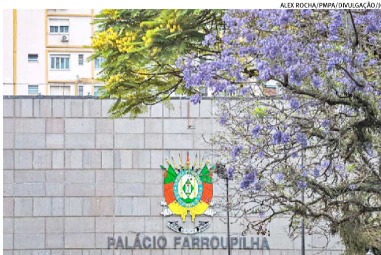
Executivo tem oito projetos em tramitação no Parlamento gaúcho

Os projetos do Executivo tratam de diversos assuntos, sendo dois relativos à proteção contra desastres no Rio Grande do Sul, tendo em vista a preocupação do governo com o El Niño neste ano, que, conforme projeções, pode causar danos ao Estado. Um dos projetos é da criação de uma Secretaria de Proteção e Defesa Civil e outra matéria é de contratação de operação de até US$ 332 milhões (cerca de R$ 1,706 bilhão, a custo de hoje) junto ao Banco Interamericano de Desenvolvimento (BID) de um "Crédito