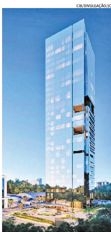
Vision, com término previsto para 2028, terá 148 metros de altura

As obras andam de maneira acelerada a partir do uso de solo grampeado na etapa de escavação dos subsolos do empreendimento.