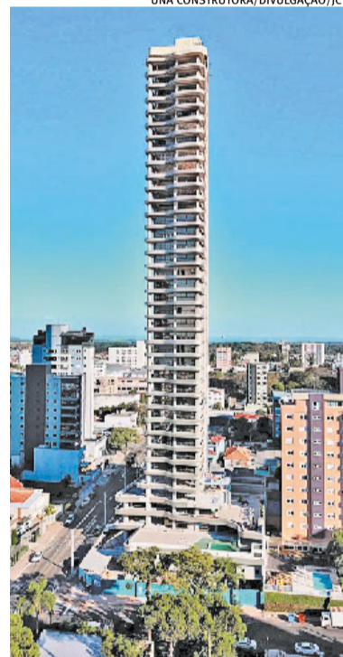
Estrutura com 140 metros de altura foi entregue em fevereiro