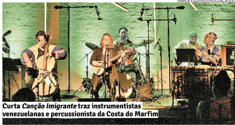
Curta Canção Imigrante traz instrumentistas venezuelanas e percussionista da Costa do Marfim