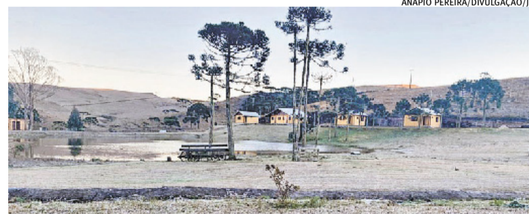
Destino mais gelado do RS vê com bons olhos a criação do roteiro turístico na região