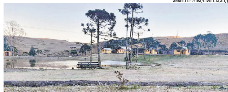
Destino mais gelado do RS vê com bons olhos a criação do roteiro turístico na região