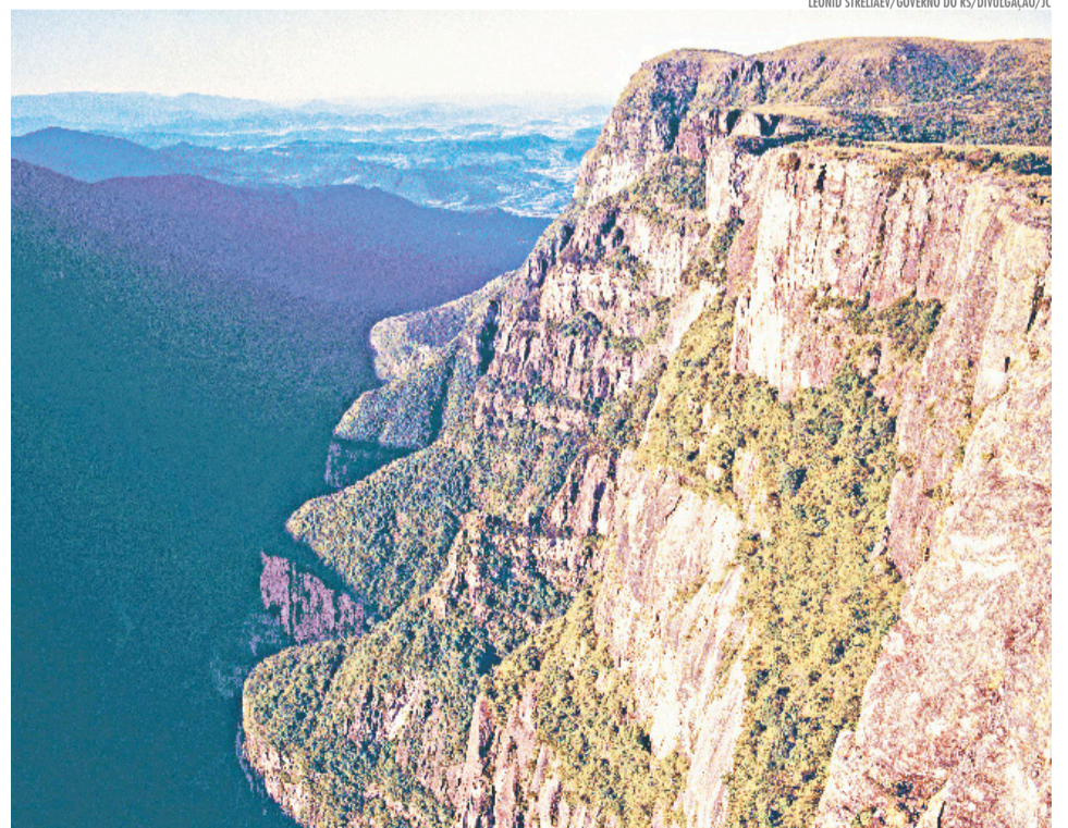
Lagos, araucárias e o charme de um inverno que convida a desacelerar