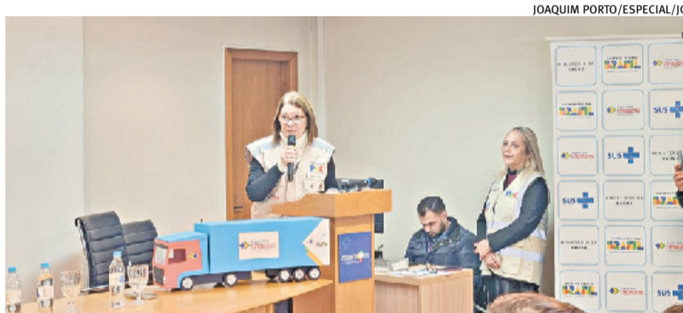
Governo federal diz que objetivo é diminuir o tempo de espera das filas

A ordem de início da obra aconteceu no dia 9 de junho, e a