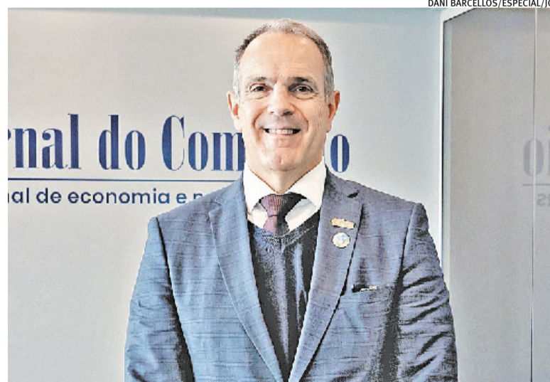
Quantia é soma de isenções ou reduções de base de cálculo, diz Jaeger