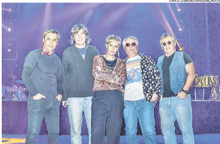
Banda Fruto Proibido faz show nesta quinta-feira, no Bar Ocidente