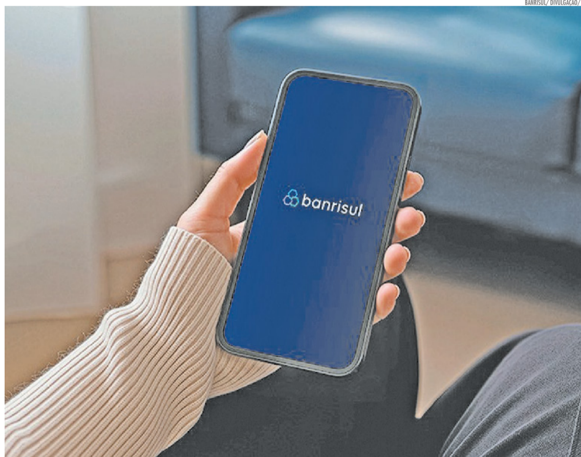
Banrisul amplia condições do crédito consignado com carência de até quatro meses para servidores estaduais e até três meses para beneficiários do INSS

Outra novidade é a exigência de validação da operação por biometria facial no aplicativo Meu INSS, procedimento que passa a ser obrigatório. A medida tem como objetivo aumentar a segurança das contratações e reduzir o risco de fraudes, garantindo mais proteção aos beneficiários.