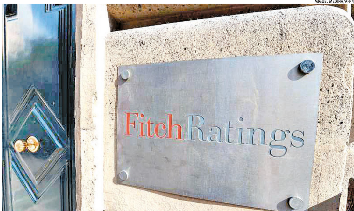
Consolidação fiscal que estabilize a relação dívida/PIB pode aumentar a nota do País, aponta agência

A nota do Brasil pode aumentar se houver uma consolidação fiscal que estabilize a relação dívida/PIB perto dos níveis atuais, mas de forma durável, e se as perspectivas de crescimento econômico melhorarem. Um rebaixamento, porém, pode ocorrer se o governo fracassar em implementar medidas capazes de melhorar a credibilidade