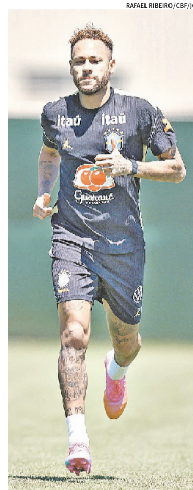
Diante do cenário, Neymar não enfrentará o Haiti na sexta-feira

Outro ponto observado por Ancelotti foi a dificuldade da equipe de trabalhar a bola no meio-campo e fazer uma recomposição defensiva em velocidade. Por isso, uma dupla de volantes formada por Fabinho e Bruno Guimarães foi promovida na atividade e tem grandes chances de começar a partida contra os haitianos.