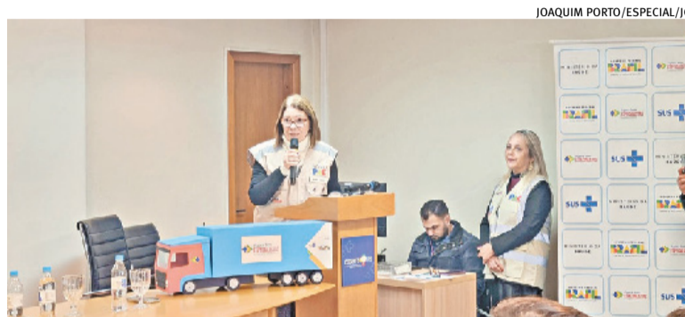
Governo federal diz que objetivo é diminuir o tempo de espera das filas

A ordem de início da obra aconteceu no dia 9 de junho, e a