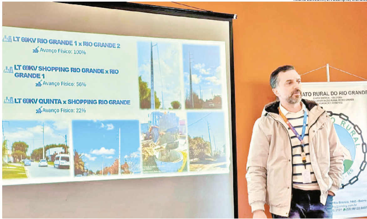
Linha de distribuição de 69 kV vai permitir a desativação de estruturas antigas e a reorganização do sistema de energia elétrica

O Sindicato Rural do Rio Grande recebeu representantes da CEEE Equatorial para a apresentação do andamento do projeto de readequação da rede elétrica que atende a região do Parque de Exposições Filinto Eládio da Silveira. A iniciativa contempla a retirada gradual da linha de alta tensão que atualmente atravessa a área do parque, considerada uma demanda histórica da entidade e da comunidade do entorno.