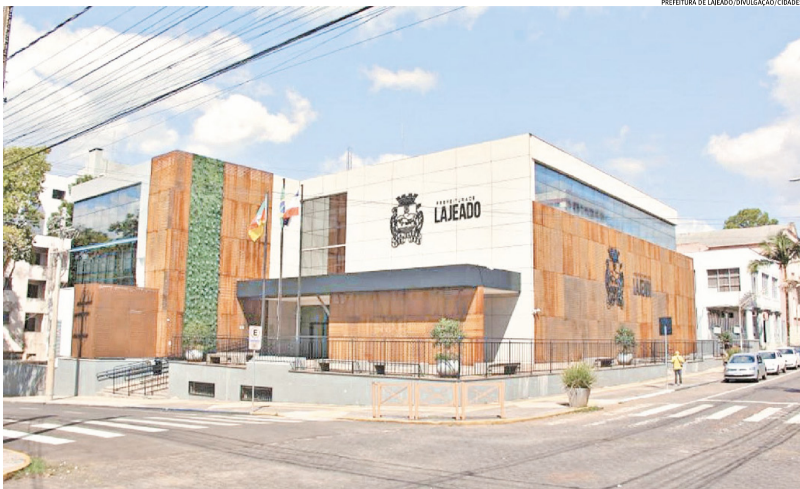
Prefeitura tem se valido do uso de dados, gerados a partir de aplicativos, e de ferramentas para criar estratégias que possam amenizar o tempo e o custo em projetos