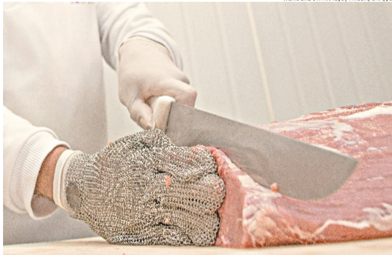
Envio de carne bovina fresca para o exterior gerou mais de US$ 4 milhões em 2026

📍 CAXIAS DO SUL - A campanha Vacina Caxias será antecipada para este sábado (20) e totalmente concentrada na Praça Dante Alighieri, sem o funcionamento das Unidades Básicas de Saúde (UBSs) neste dia - nem no último sábado do mês. O horário de atendimento será das 10h às 16h. Serão mais de 30 tipos de doses ofertadas à população, principalmente a da gripe, para toda a população. A prefeitura terá três estruturas para ampliar a imunização. A opção do dia 20 ocorre justamente porque Caxias do Sul completa 136 anos nesta data.