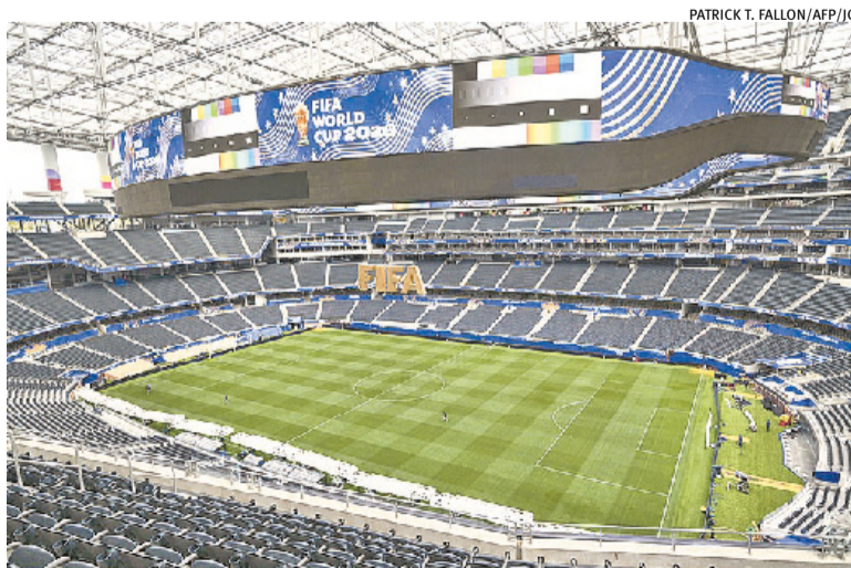
Los Angeles será palco da estreia norte-americana diante do Paraguai; em Toronto, o Canadá enfrenta a Bósnia e Herzegovina

alemães acontece às 2h, entre Costa do Marfim e Equador. Antes disso, às 17h, Holanda e Japão fazem embate pelo Grupo F e Suécia e Tunísia, também pelo grupo encabeçado pelos holandeses, encerram os confrontos do final de semana.