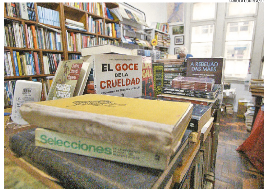
Espaços como a Calle Corrientes seguem como nicho importante, resistindo às vendas online

“Frequentei muitos sebos em Porto Alegre. Comprava bastante no Beco dos Livros, na Rua Riachuelo, e também era cliente da Livraria Aurora. Quando tinha 17 anos, muitas vezes faltava ao cursinho pré-vestibular, do qual não gostava, para passar as tardes nos sebos do Centro. Como eu já trabalhava com pesquisa teatral, adquiri muitos livros sobre teatro nesses lugares e também comecei a colecionar programas de espetáculos. Cheguei a ser tema de uma reportagem da Zero Hora por causa dessa coleção. Um dos itens que encontrei no Beco dos Livros foi o programa da peça Emily , sobre a vida de Emily Dickinson, dirigida por Miguel Falabella e estrelada por Beatriz Segall em 1984. Mais tarde, no mestrado e no doutorado, estudei o Teatro Besteirol, movimento do qual Miguel foi um dos principais expoentes, e acabei me aproximando dele por conta da pesquisa que desenvolvi na USP. Também descobri um excelente sebo em Passo Fundo durante a Jornada Nacional de Literatura de 1999. Gostei tanto que, durante um período, chegava a viajar até a cidade apenas para comprar livros. Foi lá que encontrei a edição do Teatro Completo de Qorpo Santo, organizada por Guilhermino César, obra que dialogava diretamente com a pesquisa de iniciação científica que eu realizava na Ufrgs.”