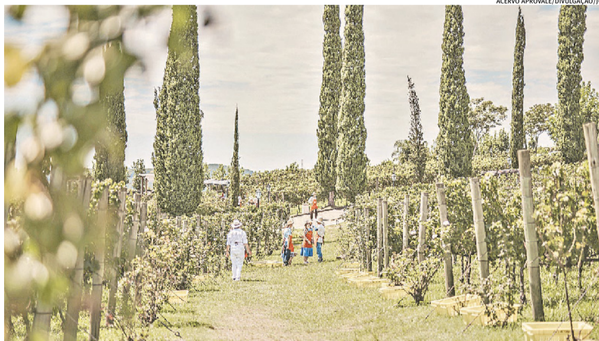
Alta industrialização, produtos com indicação geográfica e turismo favorecem resultado na Serra

"São regiões muito populosas. E as que têm o PIB per capita maior são áreas menos povoadas, que muitas vezes, têm uma alta concentração industrial numa região menor. E é uma parte do Estado que tem municípios muito ricos, como Porto Alegre, Canoas e Novo Hamburgo. Mas outros, como Alvorada e Viamão, têm uma condição bem inferior. Na média, acaba ficando para trás", explica Lazzari.