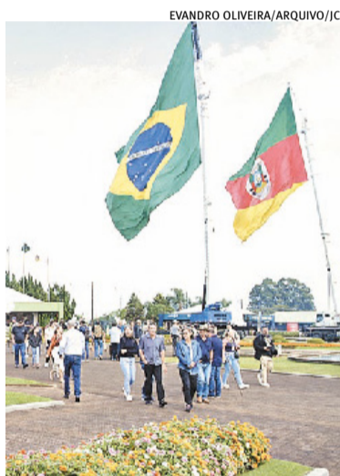
Não-Me-Toque, onde é realizada a ExpodiretoCotrijal, fica no Alto Jacuí

Entre os cinco Conselhos Regionais de Desenvolvimento (Coredes) com os maiores Produto Interno Bruto (PIBs) per capita do Rio Grande do Sul, quatro estão na Macrorregião Norte: Alto Jacuí, Noroeste Colonial, Produção e Norte. No ranking, o único Corede que não compõe a parte setentrional do Estado é a Serra, que ocupa a segunda colocação.