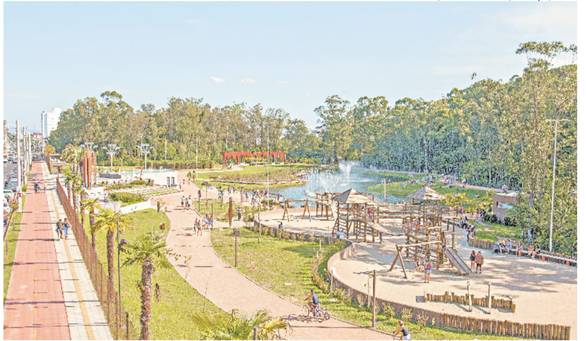
Rota vai incluir 15 cidades, com trajeto superior a 80 quilômetros; lançamento deve ocorrer oficialmente nesta quarta-feira