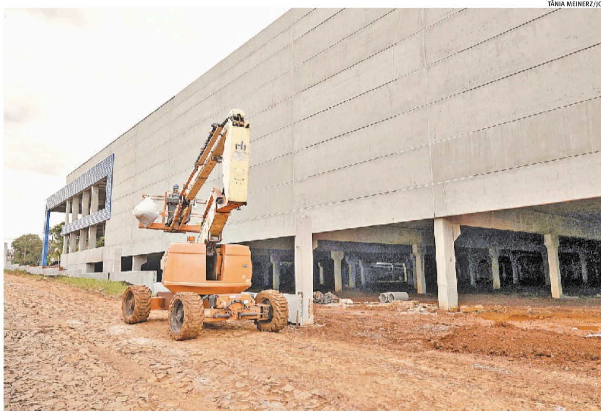
Unidade do Atacarejo Kuchak, na Linha 3 Oeste em Ijuí, em obras desde 2025, deve ser concluída neste ano

“Nós somos de Ijuí. Temos uma tradição de pai para filho. Nossa venda é bastante movimentada e sempre tivemos uma