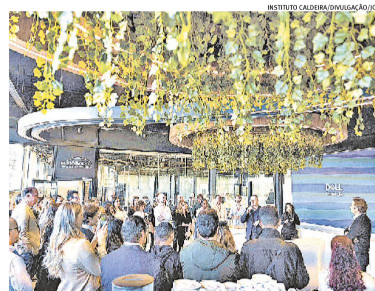
Espaço é dedicado à IA, experiência do usuário e inovação

A escolha por Porto Alegre, segundo o executivo, está associada à formação técnica, à qualidade das universidades locais e ao perfil dos profissionais. "Um dos grandes achados que tivemos na escolha de Porto Alegre foi a qualidade dos profissionais. Nos tornamos um polo exportador de talentos", afirmou. A proposta do Design Lab é usar a base gaúcha para desenvolver soluções aplicadas globalmente pela companhia. "É mais um investimento da Dell no Brasil para exportar know-how", detalha o executivo. "Temos um orgulho muito grande. Estamos mostrando como a gente consegue gerar valor no estado, sendo reconhecidos pela Dell globalmente", diz.