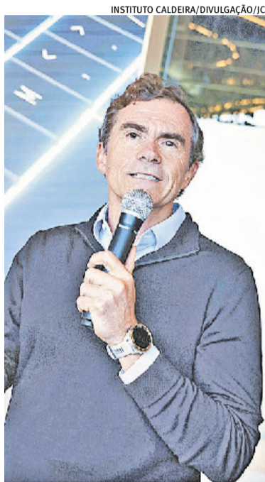
IA está reposicionando o portfólio da marca, afirma Puerta

Essa transformação, analisa Puerta, amplia o papel tradicional da infraestrutura. "Para conseguir extrair valor de dados, não se usa apenas o servidor e a infraestrutura de storage. Hoje, o PC