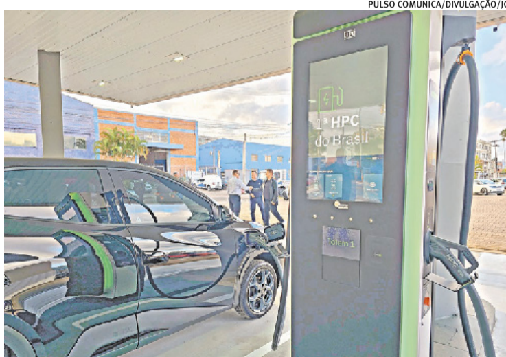
Porto Alegre tem 232 equipamentos de recarga lenta e 103 de rápida

Com 335 eletropostos públicos e semipúblicos já instalados, Porto Alegre se consolida como a sétima cidade brasileira com a maior infraestrutura de recarga para veículos elétricos do País, segundo dados da Associação Brasileira do Veículo Elétrico. p. 24