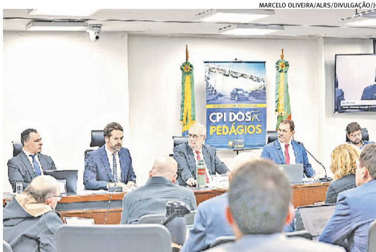
Eduardo Leite também comentou privatizações da Corsan e da CEEE

O relator da CPI, Miguel Rossetto (PT), afirmou que as concessões não são bem aceitas “nem pela população gaúcha, e nem pelos investidores”. O petista tam-