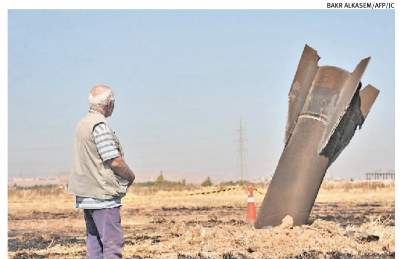
Dois lados do conflito convivem diariamente sob fogo dos mísseis

Na mesma linha, o presidente do Irã, Masoud Pezeshkian, afirmou que Teerã continua comprometido com a via diplomática, mas acrescentou que o país “não recuará diante de qualquer ameaça”. “Não abandonamos nem o campo de batalha nem a mesa de negocia-