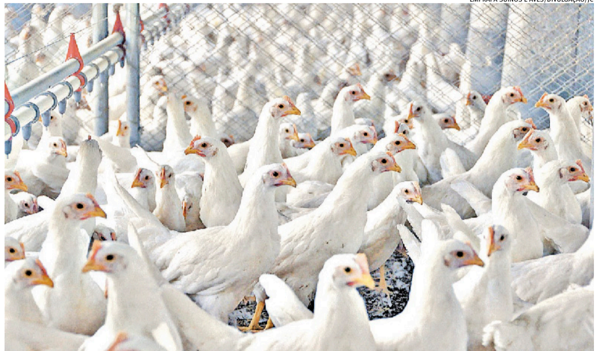
Entre janeiro e maio, produtos alcançados pela medida somaram US$ 121 milhões em vendas externas

Para a cadeia produtiva gaúcha, o impacto varia conforme o segmento. A carne de frango, por exemplo, tem a União Europeia como principal destino das exportações do Estado. Já o mel natural tem o bloco como terceiro principal mercado comprador.