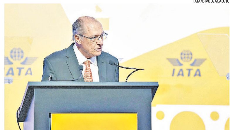
Geraldo Alckmin destacou que debate sobre descarbonização é urgente

Como parte das medidas adotadas para fortalecer o setor, o vice-presidente mencionou a redução a zero de alíquotas dos impostos PIS (Programa de Integração Social) e Cofins (Contribuição para o Financiamento da Seguridade Social) sobre o transporte aéreo regular de passageiros; a re-