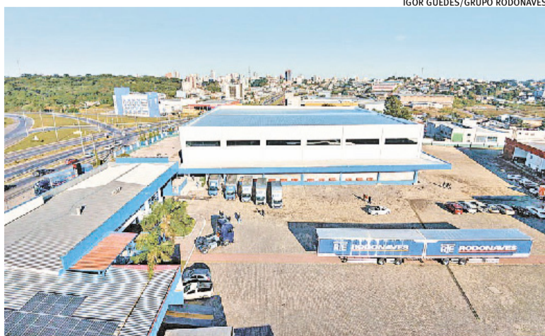
Nova sede da Rodonaves amplia capacidade de carga da empresa