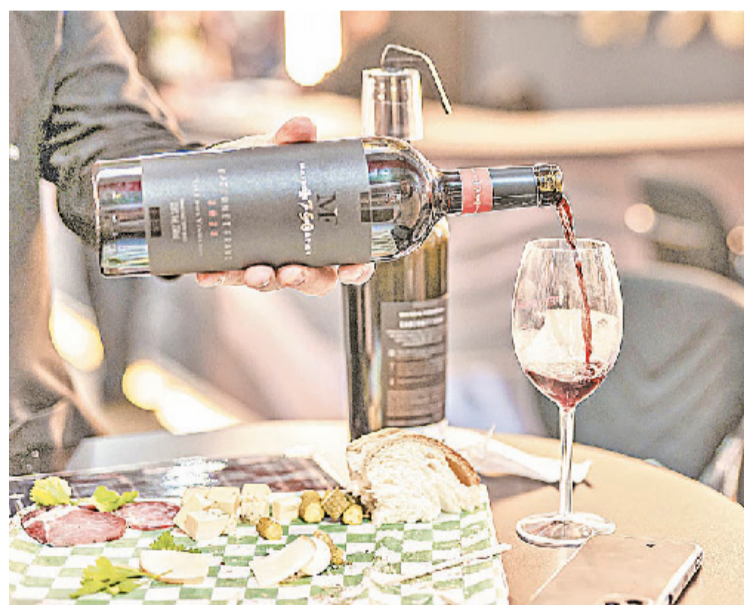
Festa celebra o legado da imigração italiana, promove o vinho brasileiro e conecta comunidade, turismo e enogastronomia em Bento Gonçalves

Criada em 1967 para promover o vinho nacional, a Fenavinho mantém esse propósito vivo. Ao mesmo tempo em que valoriza um dos principais produtos da economia local, oferece ao visitante uma