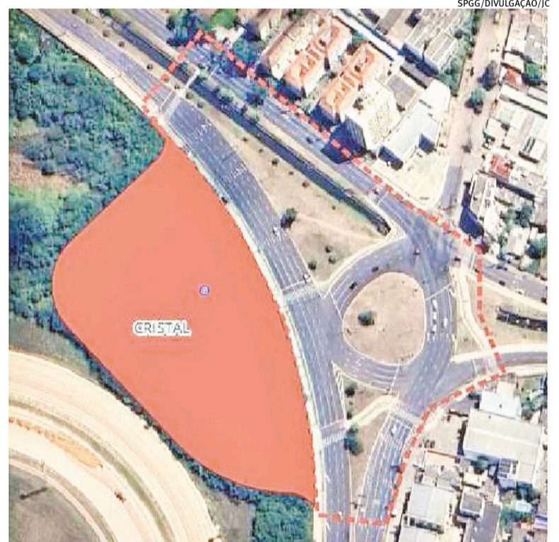
Terminal Cristal será instalado no encontro das avenidas Chuí e Icarai

A expectativa da administração municipal é concluir o processo licitatório entre 30 e 60 dias após a abertura das propostas. A intenção é assinar o contrato com a empresa vencedora em setembro, permitindo o início imediato da elaboração dos projetos execu-