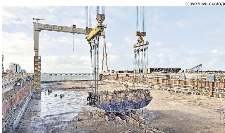
P-32 foi a primeira unidade a seguir modelo de reciclagem da estatal