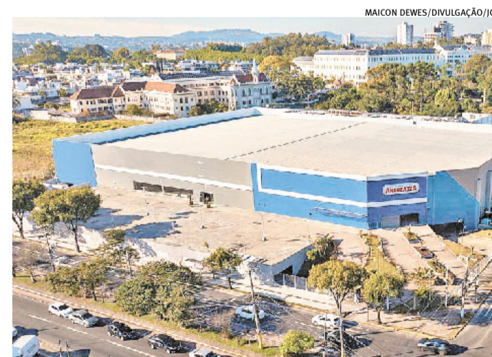
Loja ocupa empreendimento gigante e terá outras operações comerciais

Pontos do ex-Nacional terão Macromix, também Unidasul, na avenida de Aureliano Figueiredo Pinto, e Zaffari, no Praia de Belas Shopping, na Capital. Outros ex-Nacional estão indefinidos na rua José de Alencar - próximo terá um Pezzi -, na avenida Tere-sópolis e na Zona Norte, além do Litoral. O Carrefour (ex-BIG) no shopping Monet, em Santa Maria, fechou em abril e não tem anúncio de marca sucessora.