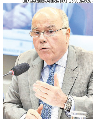
Para chanceler Mauro Vieira, não há motivos para novas tarifas

“Demos todas as informações necessárias. O que nós esperamos é que isso tudo seja levado em conta e que fique comprovado que não há por que sermos objetos de tarifas, porque todos os argumentos apresentados nós provamos que não são legítimos”, disse Mauro Vieira.