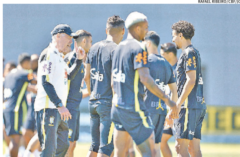
Treinador italiano deve promover uma série de alterações na equipe

panha, além de golearem a Arábia Saudita por 4 a 0 e vencerem a Rússia por 1 a 0. Na área técnica, o ídolo e maior artilheiro da história do país com 68 gols, Hossam Hassan, assumiu a seleção em 2024 e comandou o Egito para sua quarta participação na história das Copas.