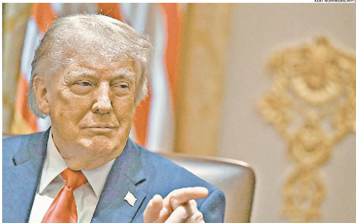
Governo de Donald Trump sugeriu uma nova tarifa adicional de 12,5% na quarta-feira