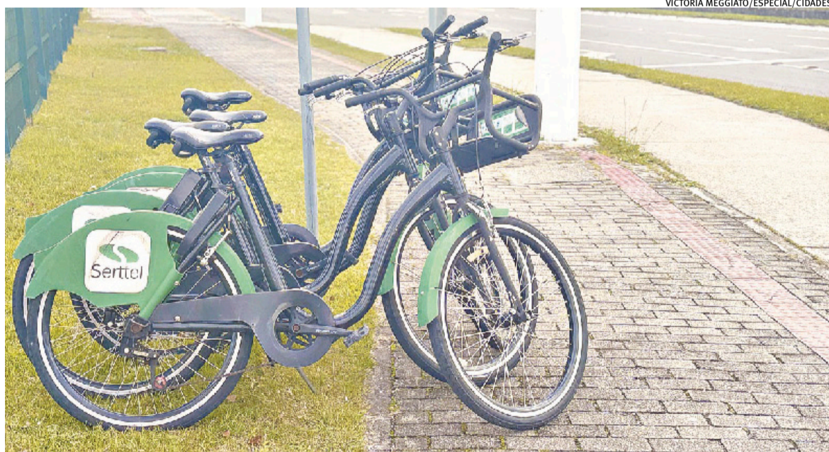
BikePel foi criado em 2019 na cidade e, desde então, gerou mais de 91,5 mil viagens e quase 33 toneladas em créditos de carbono

como o aumento do tempo de deslocamento, maior emissão de poluentes, crescimento da poluição sonora, desgaste acelerado da infraestrutura e redução da qualidade de vida.