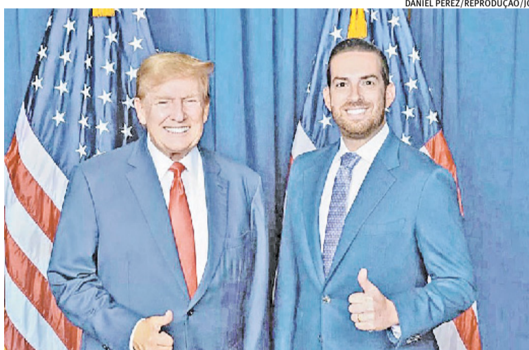
Daniel Perez, indicado por Trump para embaixada dos Estados Unidos

Até o Pix pode se tornar alvo de sanções norte-americanas por meio dessa designação, em meio a contestações americanas de que seria uma prática anticoncorrencial. Assim, poderia ser possível levantar barreiras tarifárias contra o sistema e até tentar derrubá-lo, alegando estar asfixiando o finan-