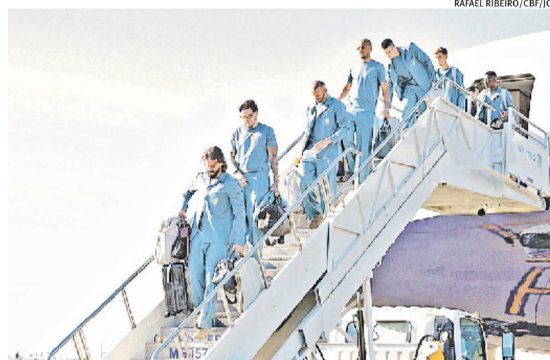
Seleção chegou em solo norte-americano na manhã desta terça-feira

para os franceses. “Gesto muito bonito. É um companheiro de Seleção. A atuação de Marquinhos é de um profissional espetacular. Neste sentido estamos tristes por Gabriel, mas isso é futebol. Podem falhar nos pênaltis quem têm coragem de cobrar. Quem não tem coragem de cobrar, não falha. Ele teve coragem, falhou. É uma derrota para ele. A derrota é o começo de uma nova vitória”, falou o italiano.