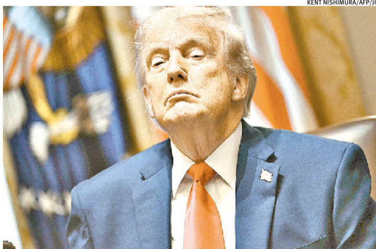
Decisão sobre aplicação ou não cabe ao presidente dos EUA, Donald Trump

A sugestão prevê 25% de tarifas sobre os produtos brasileiros, mas exclui uma ampla lista de bens considerados estratégicos para a economia dos Estados Unidos ou cuja oferta doméstica é