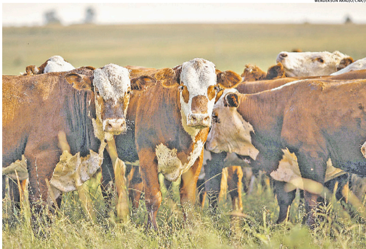
País conseguiu eliminar a circulação do vírus da aftosa e não precisa aplicar vacina de imunização

O reconhecimento do Brasil como livre da doença foi anunciado às vésperas da visita do chanceler Mauro Vieira a Pequim nesta semana. O ministro viajou à capital do país asiático para a 5ª edição do Diálogo Estratégico Global Brasil-China, mecanis-