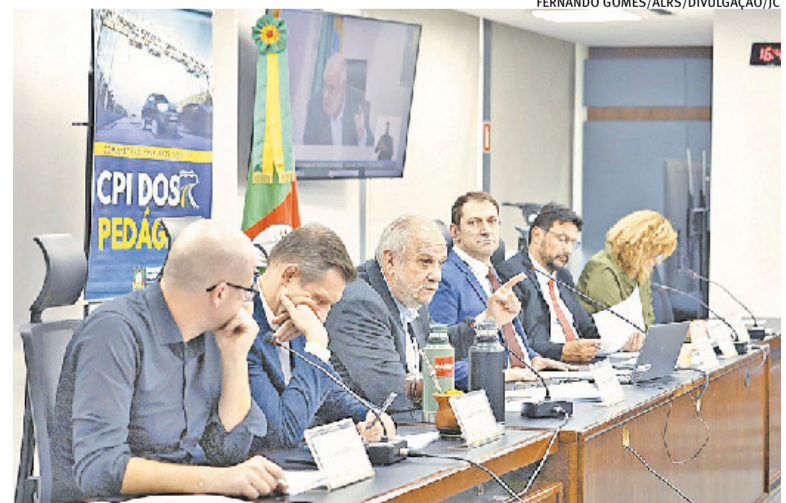
Parlamentares afirmam ter acertado roteiro e horário para sessão

Já a proposta do Bloco 1 segue em elaboração do governo, e compreende rodovias da Região Metropolitana de Porto Alegre (RMPA) e Litoral. Aliás, na semana passada o vice-governador e pré-candidato da situação ao governo gaúcho, Gabriel Souza (MDB), afirmou que o Piratini apresentará neste mês de junho nova proposta de concessão do Bloco 1.