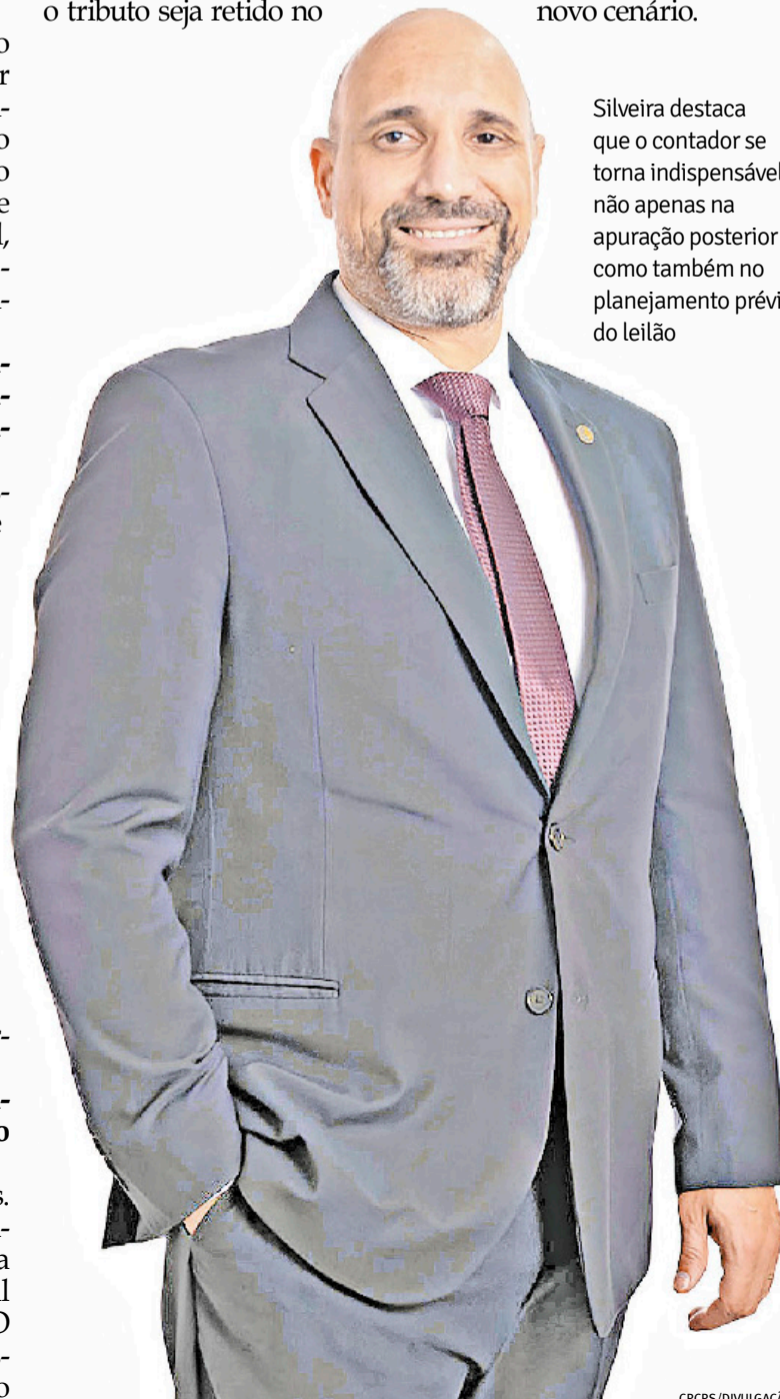
Silveira destaca que o contador se torna indispensável não apenas na apuração posterior como também no planejamento prévio do leilão

Silveira - O contador torna-se indispensável. Ele não fará apenas a apuração posterior, mas o planejamento prévio do leilão. Sem um suporte contábil para calcular o impacto do IBS e CBS e validar os créditos, tanto o leiloeiro quanto o arrematante estarão operando no escuro, sob alto risco fiscal. Mais do que cumprir obrigações acessórias, o contador passa a atuar como agente de inteligência tributária e mitigação de risco. Assim, o mercado de leilões continuará sendo extremamente relevante no Brasil, mas entrará em uma nova fase, muito mais técnica, regulada e dependente de governança tributária. Quem estiver preparado em termos de compliance, tecnologia e assessoria especializada terá vantagem competitiva significativa nesse novo cenário.